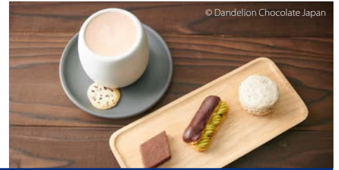
餐品内容或随季节变更。